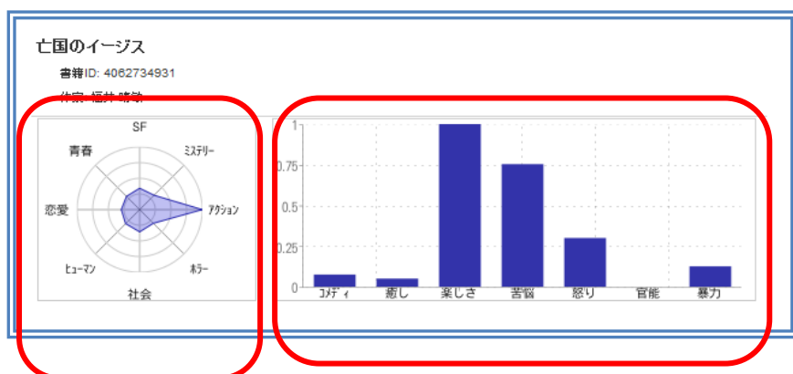
書籍内容から生成した情報

現在、書籍特微量は小説約15万タイトル、コミック約2万3千タイトル、作家特微量は約7千人の作家の特微量を生成済みです。